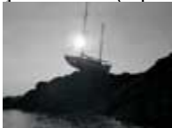
Calcul nautique faussé (reproduction interdite photo sous copyright)