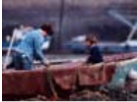
La Leçon (reproduction interdite photo sous copyright)

De nombreuses autres photographies sont visibles au Musée venez voir les clichés d' Yvonnig !