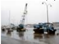
ça déborde (reproduction interdite photo sous