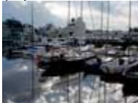
1987 (reproduction interdite photo sous copyright)