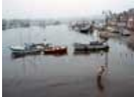
A pied