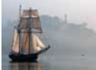
1995 Marie Dieu (reproduction interdite photo sous copyright)