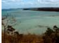
La Baie