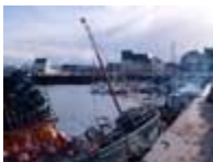
Bientôt à sec