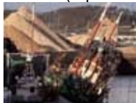
La mer se vide

► Les traces visibles de l'histoire de Paimpol se craquent et s'écaillent comme un vieux tableau. Une histoire devenue peu lisible à cause d'elle-même et qui fait que, paradoxe paimpolais, nous pourrions nous enorgueillir de ce fait plutôt négatif. Car si les repères tangibles des grands moments passés sont ici somme toute assez rares, c'est sans doute parce que ces temps forts se sont succédés avec beaucoup d'intensité pour une bien petite cité, un bien petit territoire dont rien n'en réchappait.