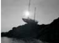
Calcul nautique faussé (reproduction interdite photo sous copyright)