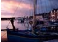
(reproduction interdite photo sous copyright)