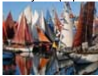
Fête des chants de marins (reproduction interdite photo sous copyright)