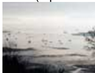
Hiver (reproduction interdite photo sous copyright)