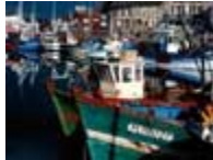
Chalutiers à quai