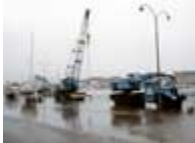
ça déborde (reproduction interdite photo sous